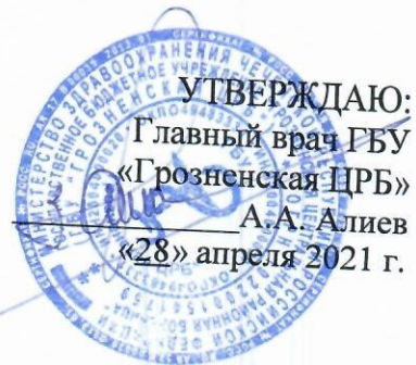
ГРАФИК дежурства работников администрации ЦРБ с 1 мая 2021 по 10 мая 2021 г.